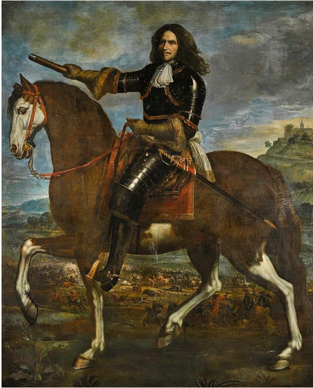
Figuur 5 Generaal Turenne

De Duitse troepen kwamen Nederland te hulp en de Franse generaal Turenne probeerde hen overal de pas af te snijden; de keurvorst van Brandenburg werd teruggedrongen tot over de Rijn, wat weer werd vereeuwigd in een medaille, die luidde “A Rheno ad Albim pulso Brandenburgensi Electore”, de keurvorst van Brandenburg wordt teruggedrongen van de Rijn naar de Elbe.