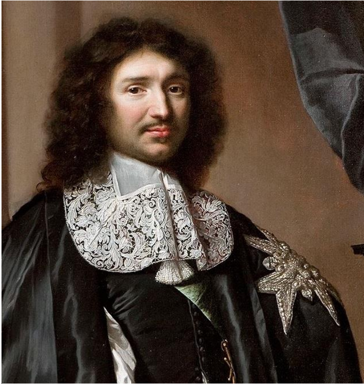
Figuur 4 Colbert

aantal dacht dat de tederheid en het vuur dat hij voelde voor madame de Montespan 32 er de oorzaak van was en dat hij het zich niet kon permitteren om haar ongerustheid niet onmiddellijk te kalmeren 33 .