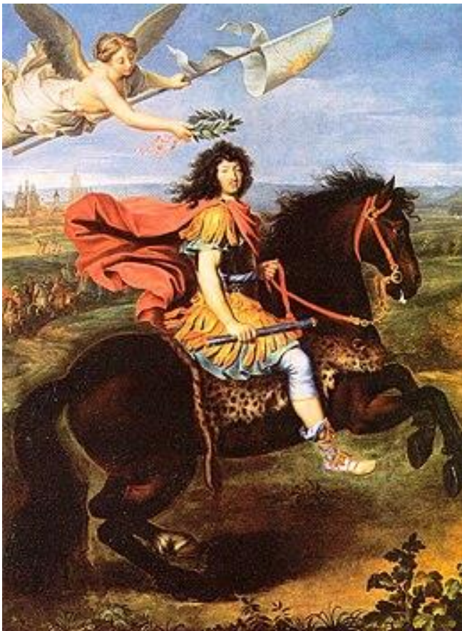
Figuur 3 Louis XIV in 1672

Ongeveer terzelfder tijd velde men in de Conseil d’ Etat een arrest waarin bepaald werd dat in de gevangenis van Normandië de mensen die beschuldigd waren van magie en hekserij – en dat waren er veel – vrijgelaten moesten worden. Dit kon op veel bijval rekenen bij alle redelijke mensen. Ware het een eeuw vroeger uitgevaardigd, dan zou dat het leven gespaard hebben van heel wat personen. In de tijden van onwetendheid wist men niks over hekserij; sinds men opgehouden heeft erin te geloven hoort men er nauwelijks nog over spreken. Dit was het eerste arrest dat gezegd werd door de opvolger van Séguier, Monsieur D’Aligre. Tot dan toe had Louis XIV zelf die functie vervuld en de Academie des Inscriptions vond dat zo mooi dat ze een medaille liet graven in brons met als opschrift: “ Rege Cancellarii munus