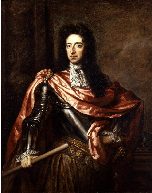
Figuur 2 Willem III, Prins van Oranje

De oorlog werd onvermijdelijk, en er moest dus een generaal benoemd worden. En de partij van Oranje verspreidde het gerucht dat De Witt hiervoor niet in aanmerking kwam, niettegenstaande zijn verdiensten, aangezien hij in het buitenland geen grote naam had, wat wel het geval was bij de prins van Oranje door de grote daden van zijn voorvaderen. De prins werd dus tot generaal benoemd. De Witt slaagde er nochtans in om de macht van de generaal te beperken. Men versterkte wel de plaatsen aan het front en verhoogde de troepenmacht, maar men benoemde ook afgevaardigden zonder wiens advies de generaal niets kon ondernemen.